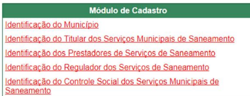
Figura 2.2 - Módulo de Cadastro do SIMISAB.

O módulo de cadastro objetiva caracterizar o município a partir de dados socioeconômicos, demográficos, referentes à sua localização, e aspectos institucionais dos serviços, como identificação e cadastramento dos prestadores (CARDOSO; MAIA; CARLOS, 2015a), mostrado na Figura 2.2 .